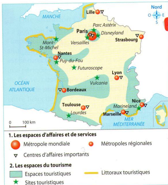
3 | Les espaces des services en France